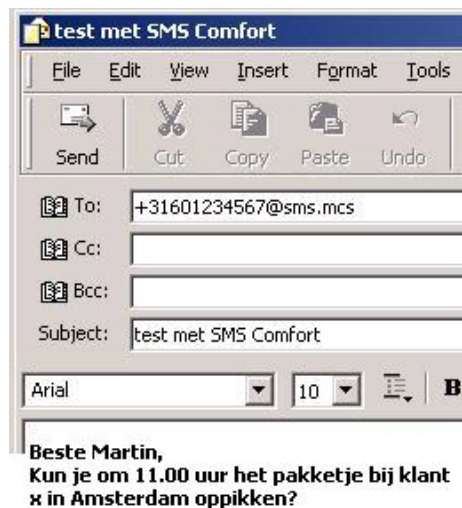
Voorbeeld van gebruik van SMS Comfort met Outlook

Het produkt kan ingezet worden in combinatie met de eigen email server of met de POP3/SMTP mail server van uw Internet provider. Daarmee is het voor elk bedrijf inzetbaar en zijn er veel situaties waarin de mogelijkheden van dit pakket gebruikt kunnen worden.